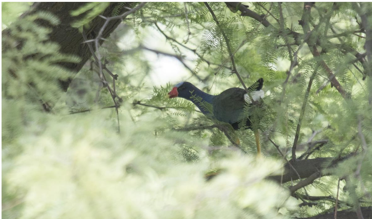
Figura N° 1. Pollona Azul ( Porphyrio martinicus ) observada en la Reserva Privada Punta del Agua, localidad de Luján, provincia de San Luis el 27 de enero de 2016.