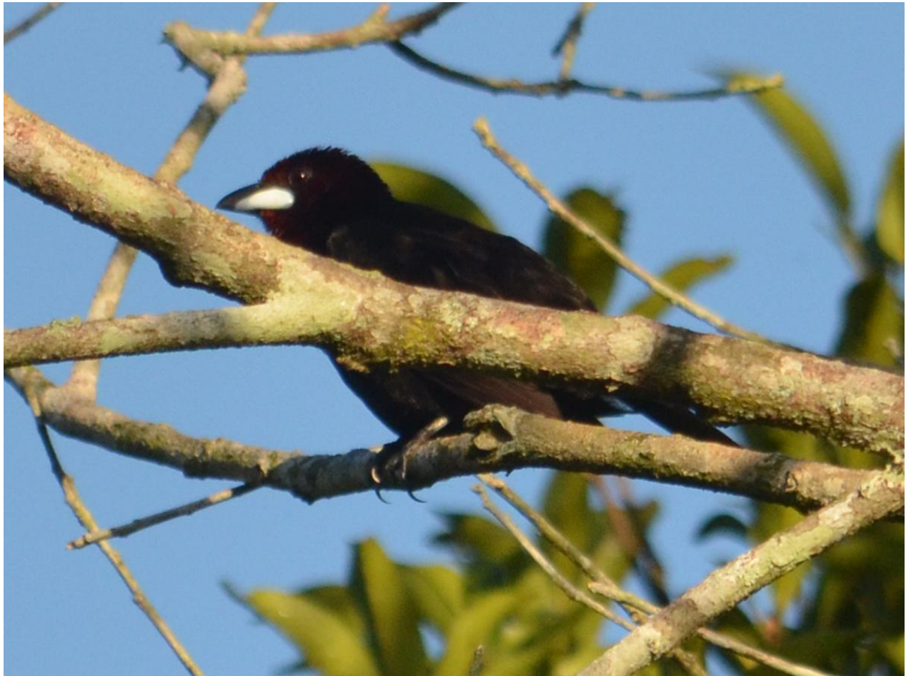
Figura N° 1. Fuego Oscuro ( Ramphocelus carbo ) donde se puede apreciar su ancha mandíbula blanca plateada. En Lodge La Misión, Misiones, Argentina, el 21 de enero de 2014.